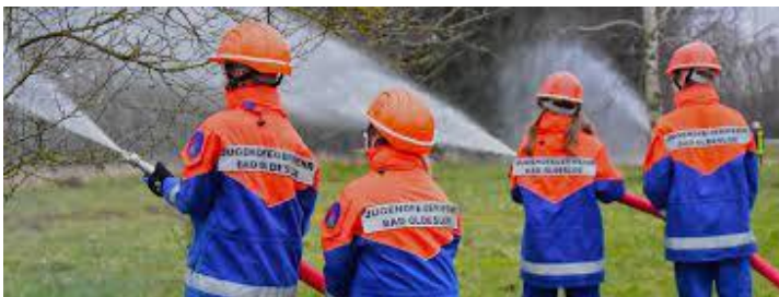
Löschen und Brandschutz