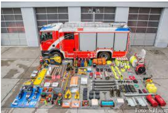
Fahrzeuge und Werkzeuge

Liebe Schülerinnen und Schüler, in der Feuerwehr AG werden wir die vielfältigen Aufgaben der Feuerwehr kennenlernen: „Retten- Löschen- Bergen- Schützen“